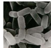
乳酸菌 シロタ株 (L.カゼイYIT9029)