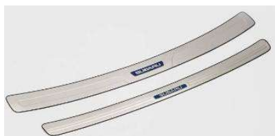
カーゴステップパネル