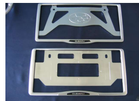
ナンバープレートベース