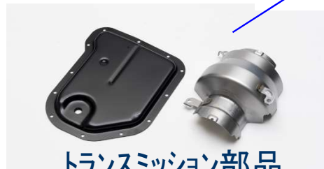
トランスミッション部品