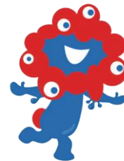
公式キャラクター ミヤクミヤク

2024年9月25日～ 2024年10月6日に 来場日・希望パビリオン・ 希望催事について 第5希望まで登録