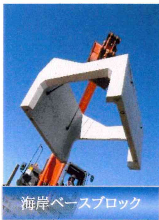
海岸ベースブロック

募集職種 営業職・製造職 初任給 190,000円(高卒者) 210,000円(大卒者) 諸手当 職務手当、役職手当、通勤手当、皆勤手当 昇給 年1回(5月) 賞与 年2回(8月・12月) 決算賞与【好業績時 過去33回支給】 休日休暇 当社カレンダーによる(年間109日) GW・夏季&年末年始長期連休有 福利厚生 各種社会保険 ※令和7年度 完全土日休み(休日日数増)