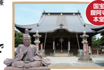
国宝 鑿阿寺 本堂