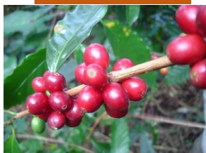
コーヒーチェリー