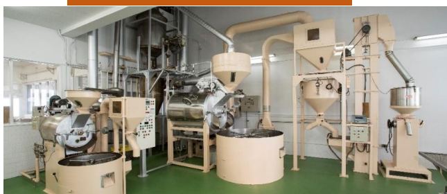
焙煎工場 (ロースト・グラインド)