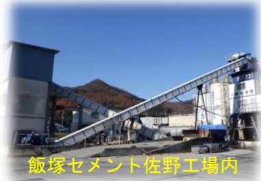
飯塚セメント佐野工場内

昭和 20 年にセメント瓦製造から始まり、東北仙台湾護岸工事・東京外環東名道までコンクリート製品を製造・納入している会社です。 100 年続く会社を目指して、災害から国土を守り、人を守るコンクリート製品造りに、皆様と励みたいと思っている会社です。