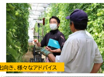
生産現場に向き、様々なアドバイス