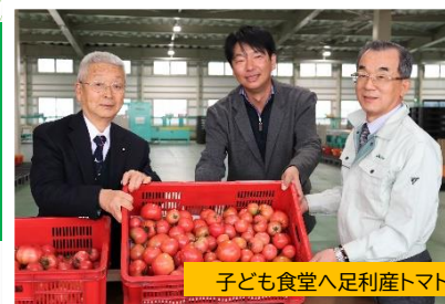
子ども食堂へ足利産トマトの寄贈

組合員(農家)に対して営農指導をするほか、地域で生産された農畜産物の共同販売、生産資材・生活資材の共同購入等により「農業者の所得増大」を目指しています。 また、貯金の受入、資金の貸付を行う信用事業や、万一の場合に備える保障を提供する共済事業により、組合員・利用者のライフプランサポートも行っています。 その他、「食」や「農」にふれあうイベントの開催や、不動産の供給、葬祭ホールや介護施設の運営等、地域の皆様の生活をより豊かにする事業を幅広く行っています。 JAの職員は各事業部門において、組合員・利用者を第一に考え、それぞれの業務に励んでいます。