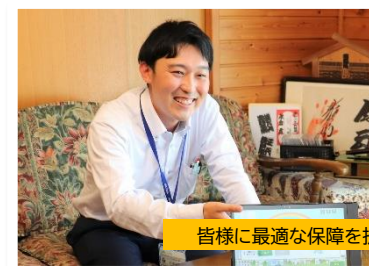
皆様に最適な保障を提案します