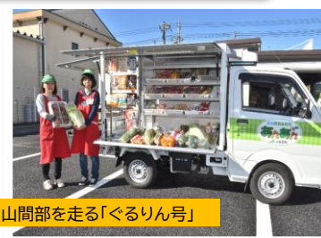
市内山間部を走る「ぐるりん号」