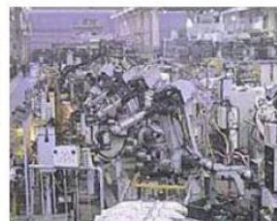
溶接ロボットなどで無人化された業界有数の組立ライン