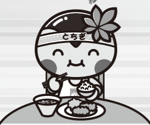
栃木県マスコットキャラクター 「とちまるくん」