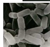
乳酸菌 シロタ株 (L.カゼイYIT9029)